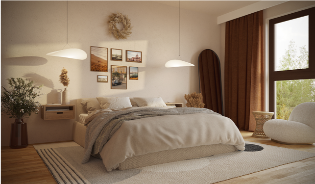
Widok na dużą sypialnię główną