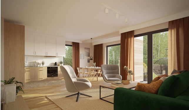
Widok na jasny salon z południową ekspozycją