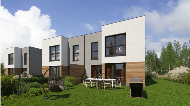
Widok od strony ogrodu