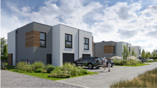
Widok od strony wjazdu na osiedle